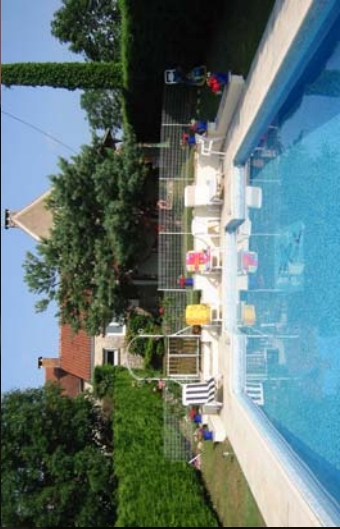
La piscine (10m x 5m, 2m extrémité profonde)

est couvert de tuiles avec les étapes romaines et peut être entièrement inclus. Il a le soleil toute la journée et est paisible, privé et reculé. Il y a des secteurs ombrés dans le jardin et les vues étendues des forêts et des vallées du Bouriane à l'ouest.